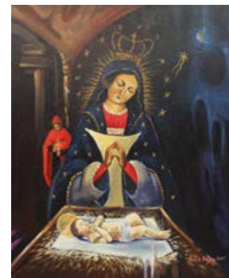
"Virgen de la Altigracia" 2017 Acrilica / Tela - 37 x 45 cm