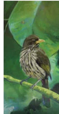
"Cigua Palmera" 2017 Mixta / Tela - 79 x 39 cm