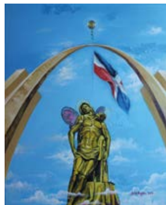
"Guardian de la Patria" 2016 Acrilica / Tela - 37 x 45 cm