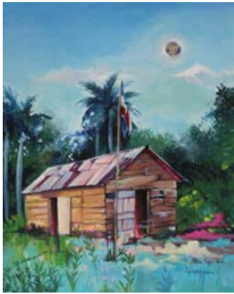
"Patriota Incondicional" 2015 Acrilica / Tela - 21 x 31 cm