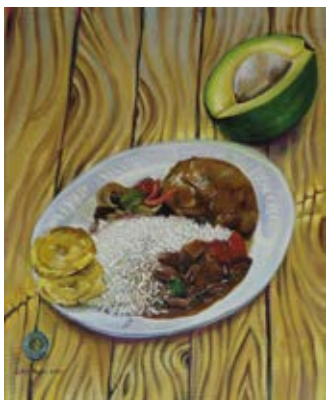
"La Bandera" 2016 Acrilica / Tela - 38 x 45 cm