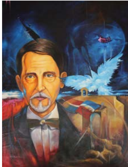
"Pescando Libertad" 2015 Acrilica / Tela - 77 x 102 cm