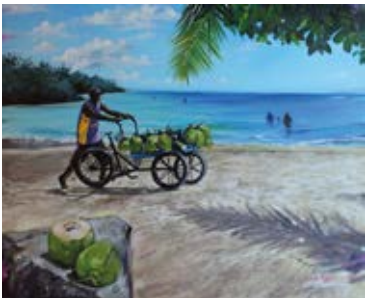
"El coquero" 2017 Acrilica / Tela - 45 x 37 cm