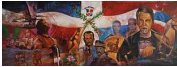
"Cronología de los Hechos" 2015 Acrilica / Tela - 40 x 75 cm