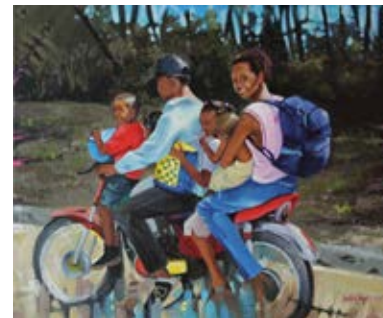
"Motoconcho" 2017 Acrilica / Tela - 45 x 37 cm